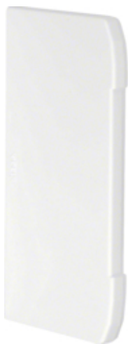
tehalit.BRN Końcówka 70130 biały