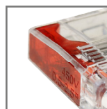
kolorystyka ułatwiająca identyfikację modelu