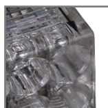
obudowa wykonana z wysokiej jakości poliwęglanu