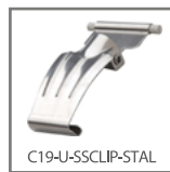
C19-U-SSCLIP-STAL opcjonalne metalowe klipsy