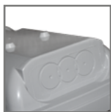
możliwość zasilania przelotowego