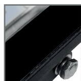
wytrzymałe szkło hartowane