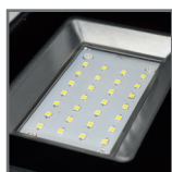
wbudowane diody LED