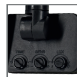
regulacja czujnika ruchu