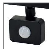
zintegrowany czujnik na podczerwień