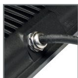
dławnica z przewodem zasilającym