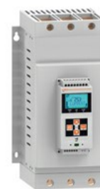
Softstart ADXL Asynchroniczny trójfazowy