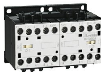
Styczniki w układzie nawrotnym BGT12