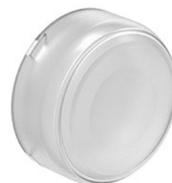
Gumowa uszczelka do krytego przycisku LPC B1/BL1/R1.. LPXAU138