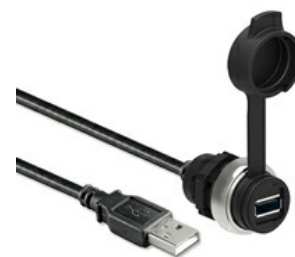
Interfejs USB, podłączenie żeńskie A/A z 1 m kablem LPCD0