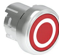
Przyciski, samoczynny powrót, z symbolem LPSB11