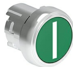
Przyciski, samoczynny powrót, z symbolem LPSB11