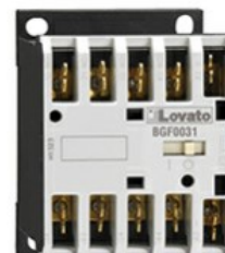
Stycznik pomocniczy BGF00