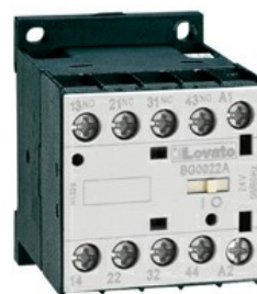
Stycznik pomocniczy BG00