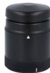
Kolumna sygnalizacyjna Ø70mm/2,75" 8LT7S - Moduły dźwiękowe