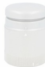
Kolumna sygnalizacyjna Ø70mm/2,75" 8LT7S - Moduły dźwiękowe