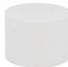
Kolumna sygnalizacyjna Ø70mm/2,75" LTN70