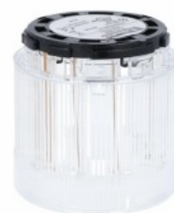
Kolumna sygnalizacyjna Ø70mm/2,75" 8TL7FL - Moduły światła błyskawicznego