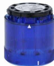
Kolumna sygnalizacyjna Ø70mm/2,75" 8TL7FL - Moduły światła błyskowego