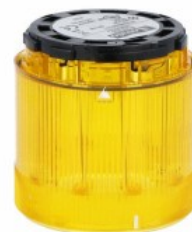
Kolumna sygnalizacyjna Ø70mm/2,75" 8TL7FL - Moduły światła błyskawicznego