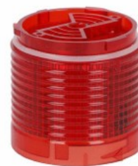
Kolumna sygnalizacyjna Ø50mm/1,97" LTN50