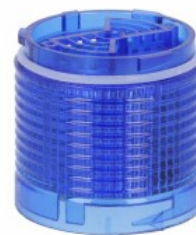
Kolumna sygnalizacyjna Ø50mm/1,97" LTN50