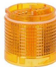
Kolumna sygnalizacyjna Ø50mm/1,97" LTN50