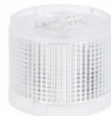
Kolumna sygnalizacyjna Ø70mm/2,75" LTN70