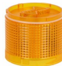
Kolumna sygnalizacyjna Ø70mm/2,75" LTN70