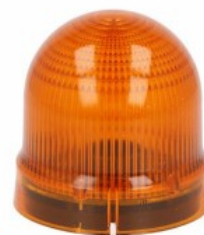
Sygnalizatory optyczne Ø62mm/2,44" 8LB6EL