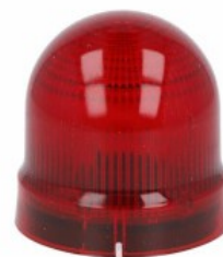
Sygnalizatory optyczne Ø62mm/2,44" 8LB6GL