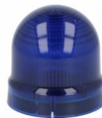
Sygnalizatory optyczne Ø62mm/2,44" 8LB6GL