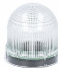
Sygnalizatory optyczne Ø62mm/2,44" 8LB6S