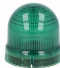
Sygnalizatory optyczne Ø62mm/2,44" 8LB6S