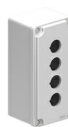
Obudowy z otworami \varnothing 22mm – z otworami na 4 przyciski LPZM