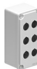
Obudowy z otworami Ø 22mm – wielootworowa na 6 przycisków LPZM