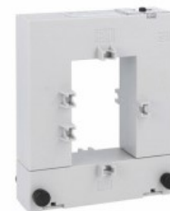
Przekładniki prądowe DM1TA1000