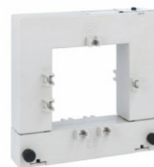
Przekładniki prądowe DM2TA1000