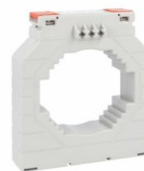
Przekładniki prądowe DM4T1250