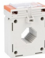
Przekładniki prądowe DM1TP0150