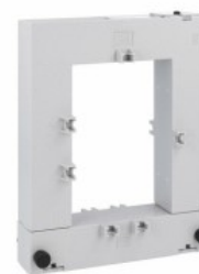
Przekładniki prądowe DM3TA1500