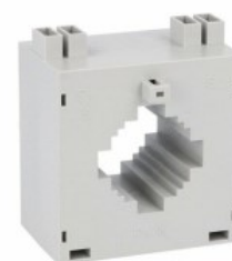
Przekładniki prądowe DM3T0200