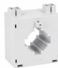
Przekładniki prądowe DM3T0600