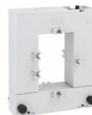
Przekładniki prądowe DM1TA0800