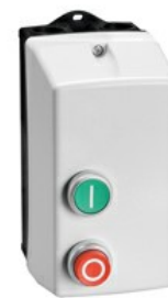
Rozrusznik bezpośredni M0P00910