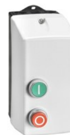
Rozrusznik bezpośredni M1P00912...A9