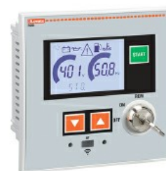
Sterownik agregatów wolnostojących RGK420SA