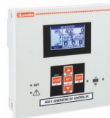
Sterowniki agregatu z funkcją kontroli parametrów sieci RGK600