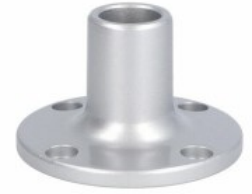
Kolumna sygnalizacyjna Ø70mm/2,75" LTN70