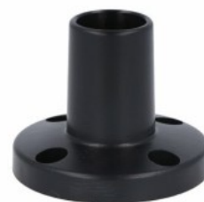
Kolumna sygnalizacyjna Ø70mm/2,75" LTN70