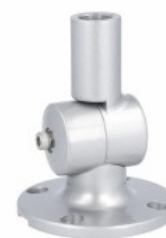
Kolumna sygnalizacyjna Ø50mm/1,97" LTN50