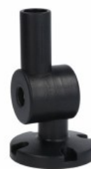
Kolumna sygnalizacyjna Ø50mm/1,97" LTN50