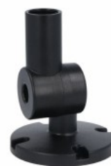
Kolumna sygnalizacyjna Ø70mm/2,75" LTN70