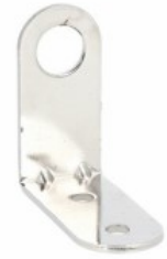
Kolumna sygnalizacyjna Ø50mm/1,97" LTN50