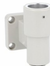
Kolumna sygnalizacyjna Ø70mm/2,75" LTN70