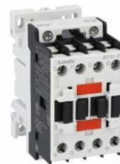
Stycznik pomocniczy BF00